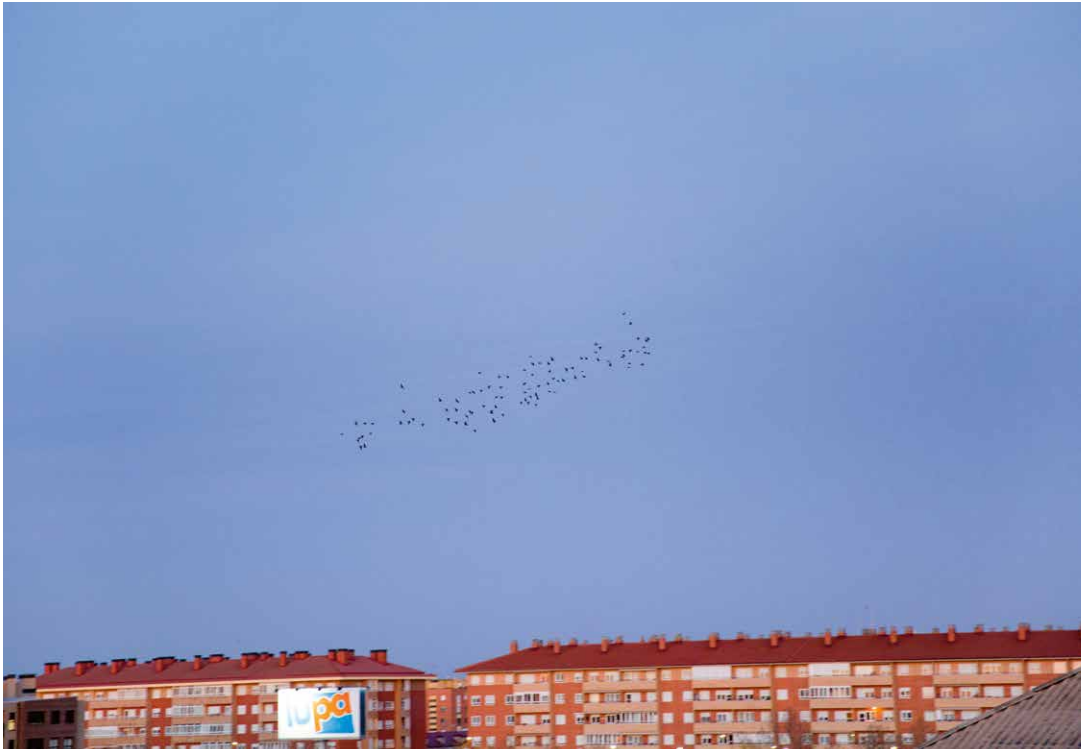
It Might As Well Be Spring, 2019