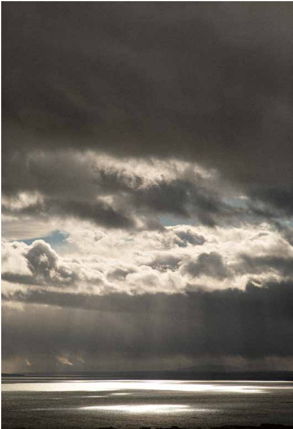
Kitchen Window Sky II, 2021