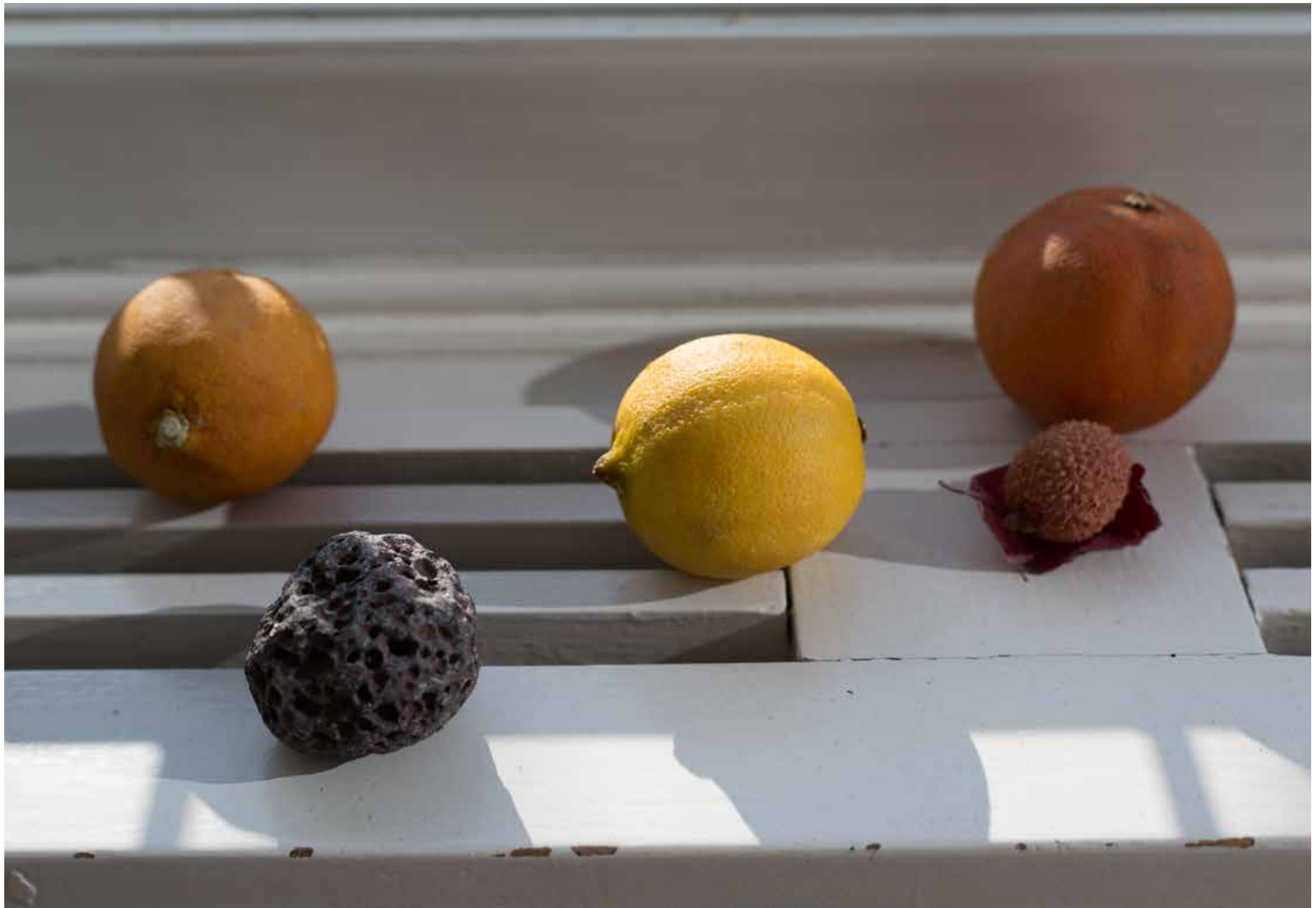
Solar System, 2019