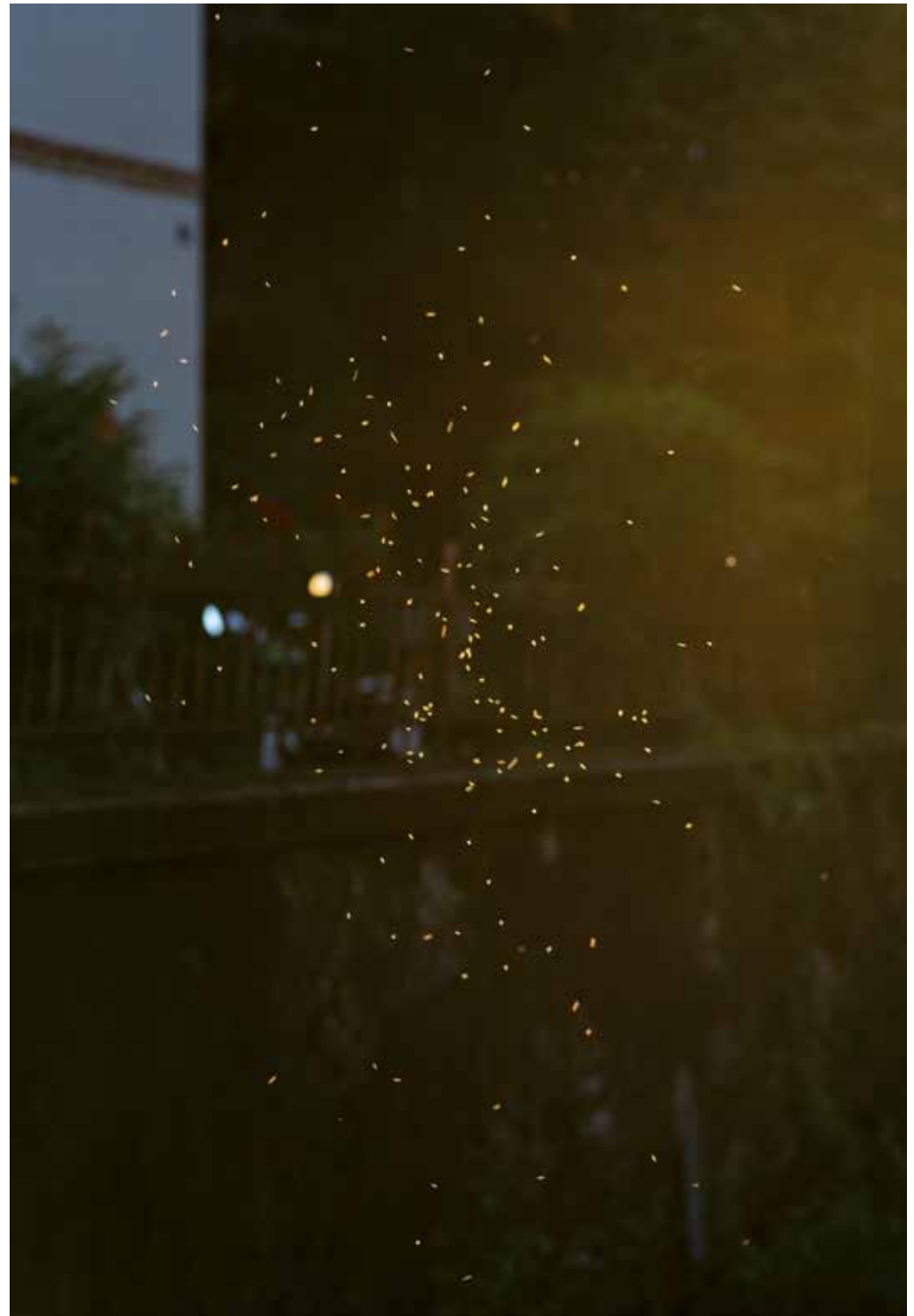
Golden Afternoon, 2021