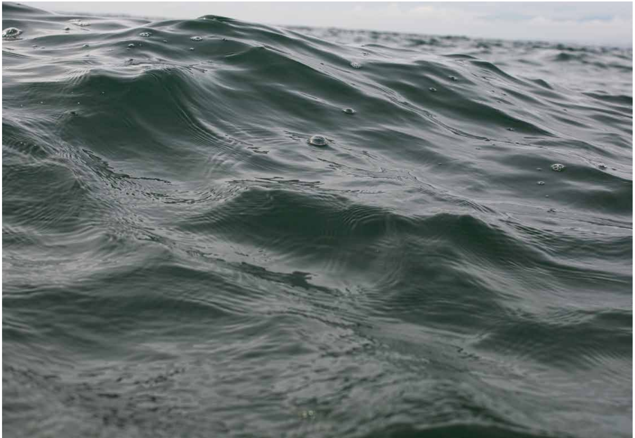
A Multitude of Drops, 2020