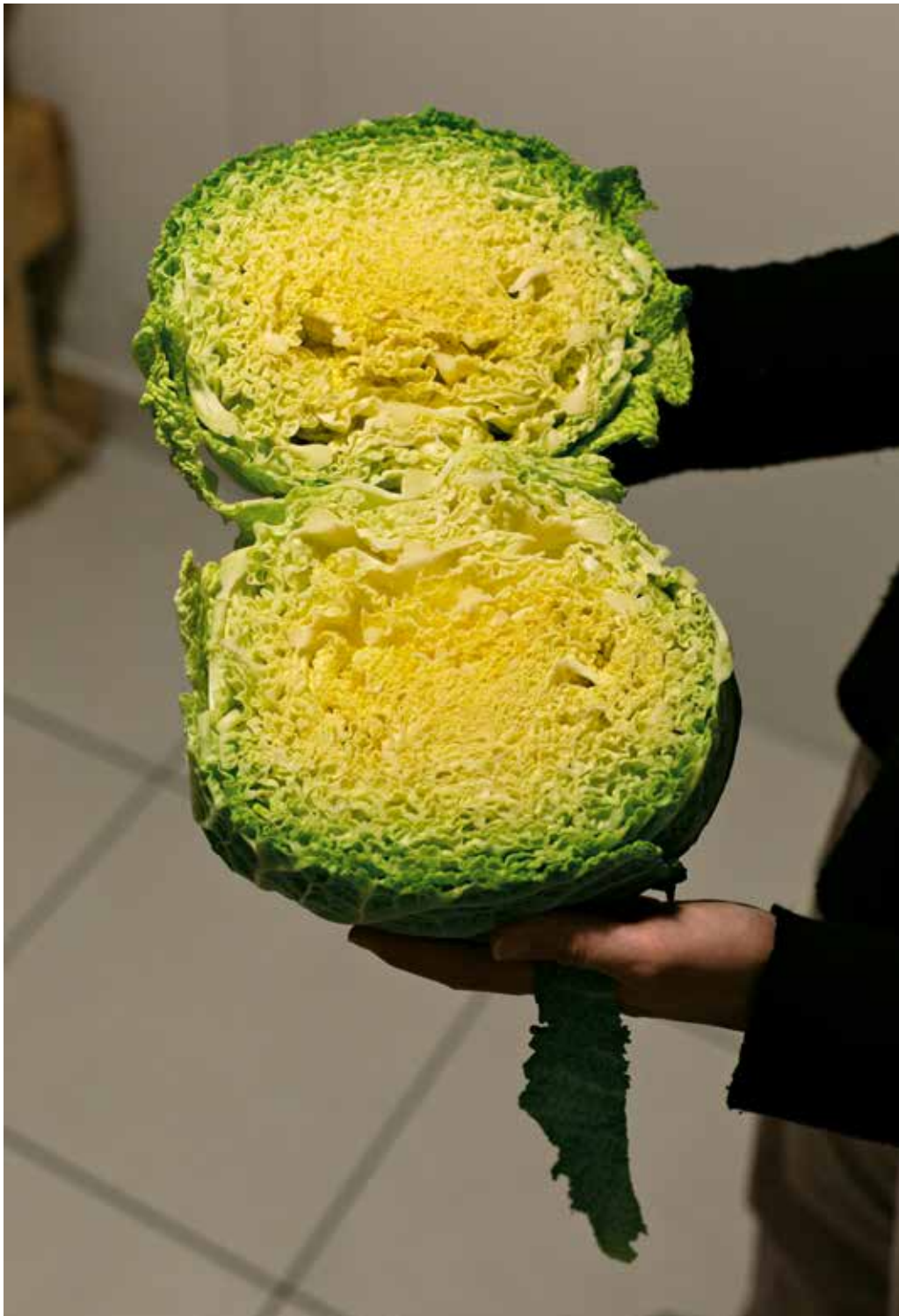
Open Up, 2020